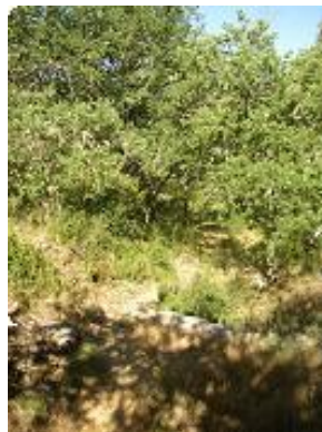
[8] Le petit sentier vers le Verdon.