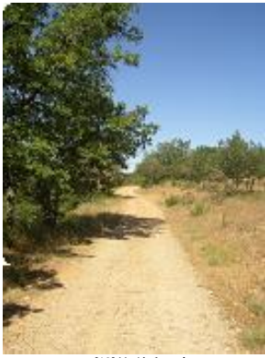
[13] Un légère côte.