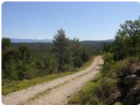
[19] Continuons le chemin.