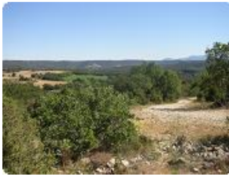
[17] A gauche, le belvédère.