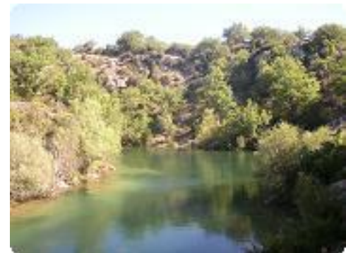
[12] L'eau est transparente.