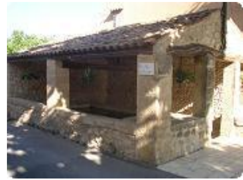
[3] Un ancien lavoir.