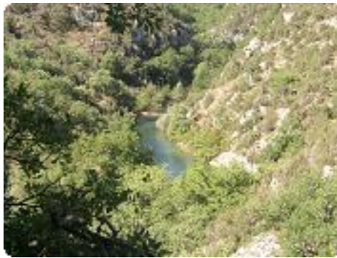
[14] Tiens, on était en bas tout à l'heure.