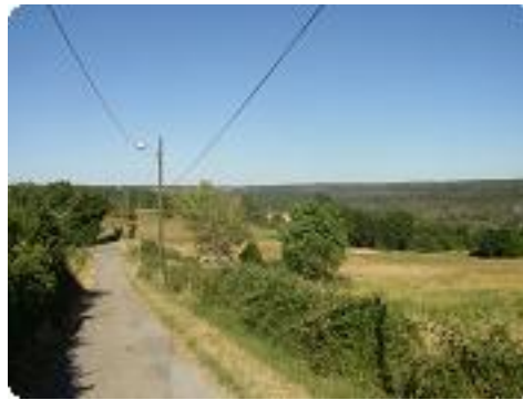
[5] A droite vers le vieux moulin.