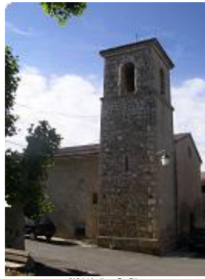
[2] L'église St-Pierre.