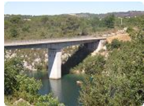
[21] Un pont sur le Verdon (D471).