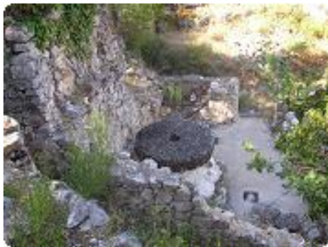
[7] L'ancien moulin de Vallefont.