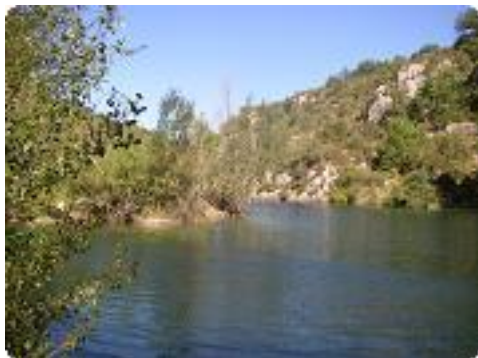
[10] et plouf...