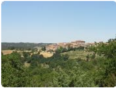
[1] Le village d'Artignosc s/ Verdon.