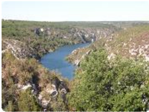
[16] Vue sur le Verdon.