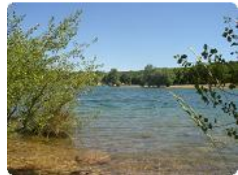
[24] .. et agréable.