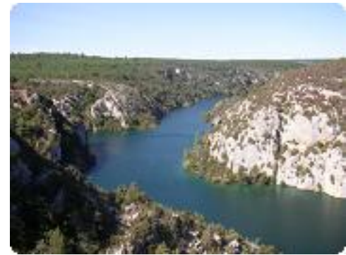
[18] Le Verdon depuis le belvédère.