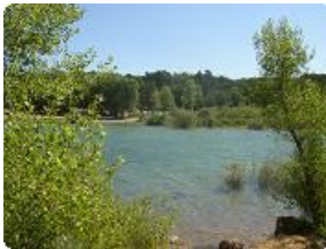
[23] Un lac tranquille...