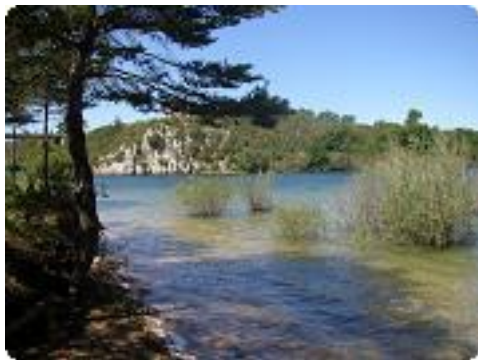
[22] Arrivée au lac.