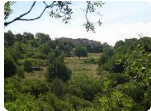
[15] Le village d'Artignosc.