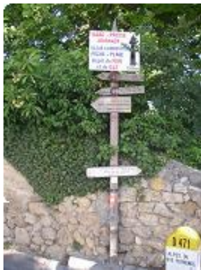
[4] Début du Chemin de l'Eau.