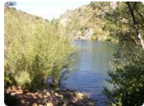
[9] Arrivée près de l'eau...