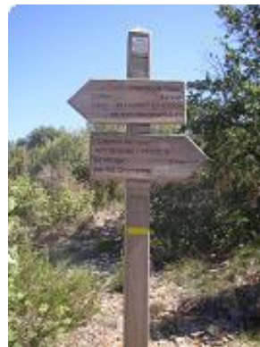
[20] Le chemin des Grignolets pour le retour.