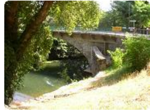
[6] Le pont sur le Caramy.