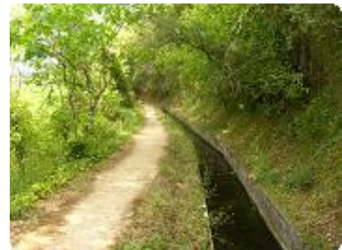
[12] Le sentier suit le canal.