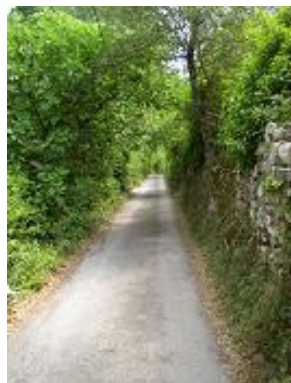
[11] La vieille route longe des murs de pierre.