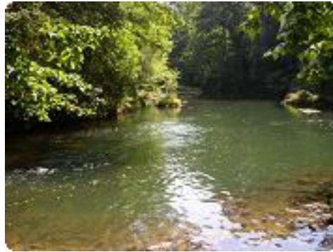
[5] Au confluent de l'Argens et du Caramy.