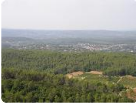
[26] Vue sur Carcès.