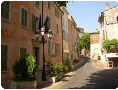
[1] La mairie du village.