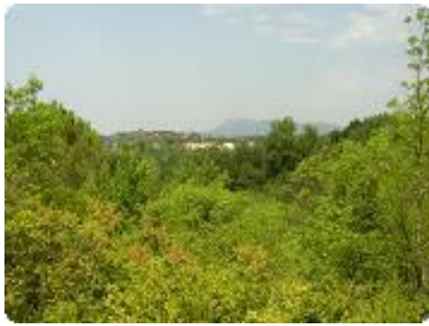
[13] Un paysage très vert.