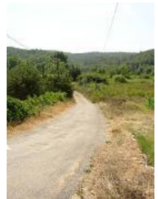
[9] Retour sur une vieille route.