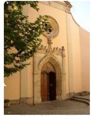
[3] L'église St Marguerite (XVIe).