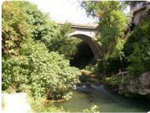
[4] Le pont sur l'Argens.