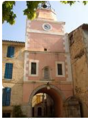
[2] La tour de l'horloge.