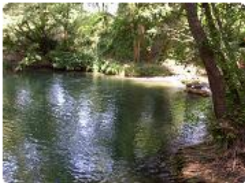
[10] Un petit endroit idyllique à connaître.