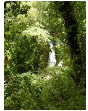
[15] Derrière la végétation, les chutes.