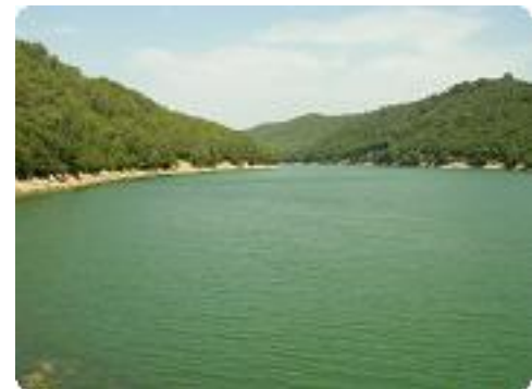
[24] Un lac de 100 hectares.