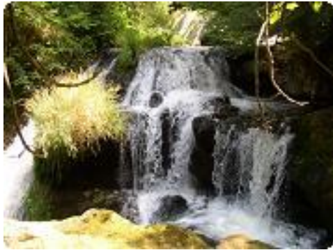
[16] Une partie des chutes en plan rapproché.