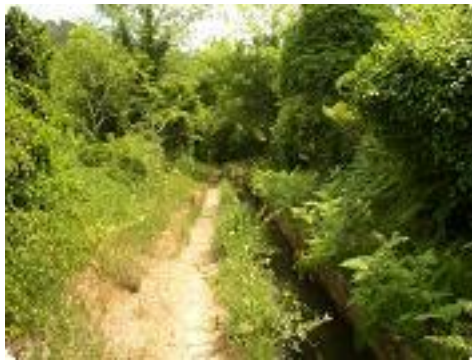
[14] L'endroit est envahi de fougères.