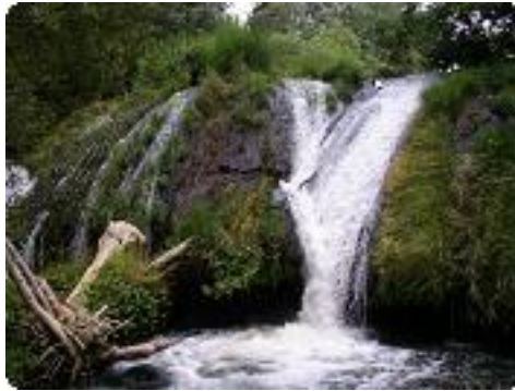
[17] De l'eau, beaucoup d'eau.