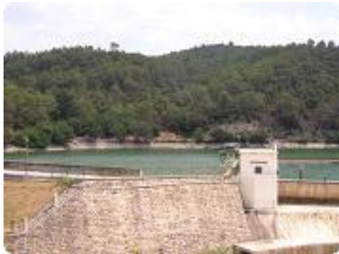
[19] Le barrage du lac.