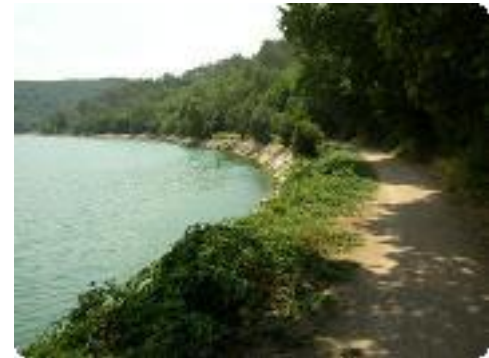
[21] La piste autour du lac.