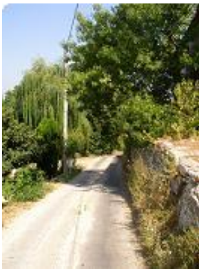
[7] Une route tranquille vers la chapelle.