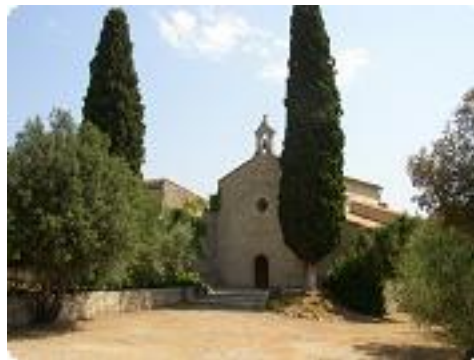
[8] La chapelle Notre Dame de Caramy.