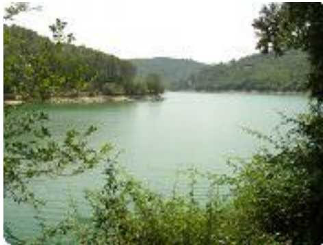
[20] Le lac.