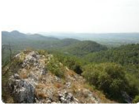
[25] Vue sur les collines.