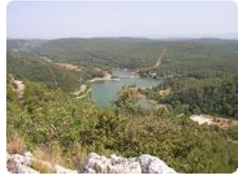
[27] Vue sur le lac.