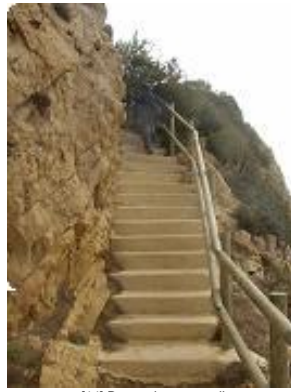
[14] De nombreux escaliers.