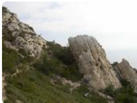
[23] Le sentier du douanier.