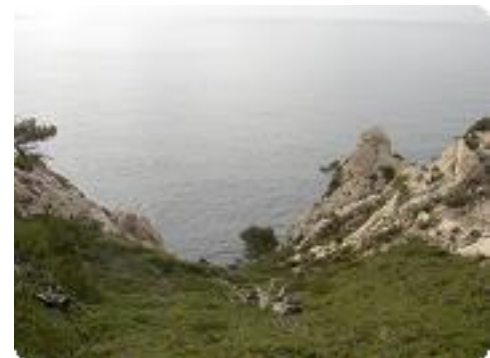
[24] La mer.