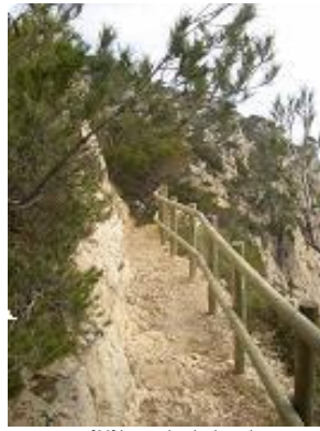
[26] Le sentier du douanier.