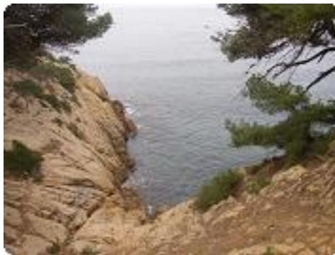
[11] Une crique.