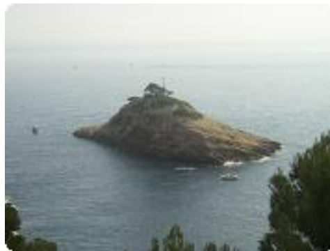
[35] Devant l'île.