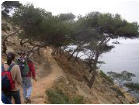
[13] Le sentier du douanier.