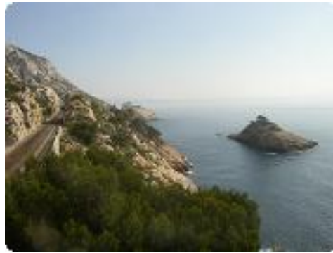
[32] L'île d'Erevine.