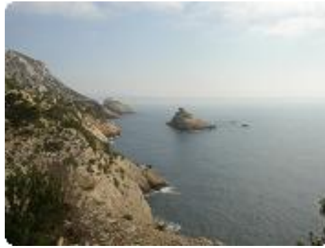
[29] L'île d'Erevine.