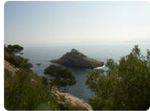
[33] L'île d'Erevine.