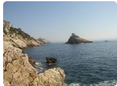
[36] La Fin.