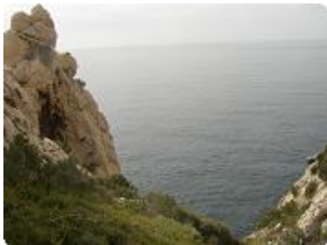
[22] La vue.