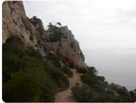
[17] Le sentier du douanier.