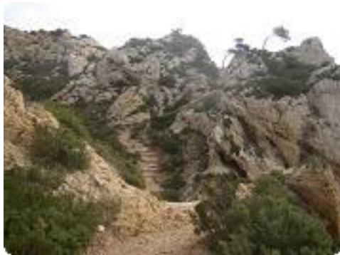
[19] Le sentier du douanier.