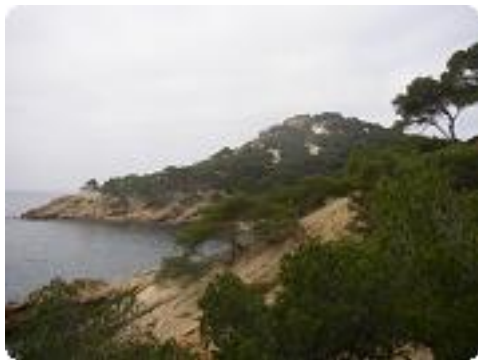
[10] Vue en arrière.