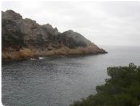
[8] Vue sur le cap.