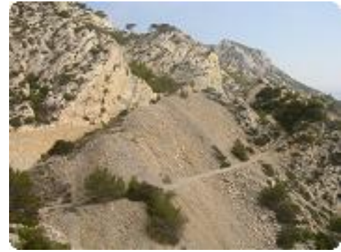
[30] Le sentier du douanier.