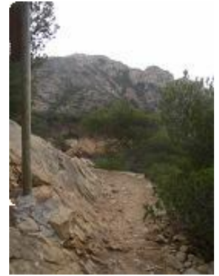
[6] Le sentier du douanier.