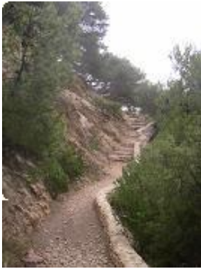
[4] Le sentier du douanier.