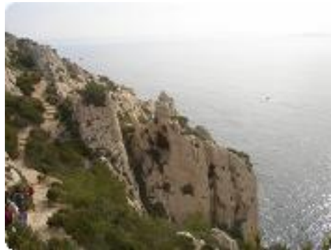
[20] La vue.