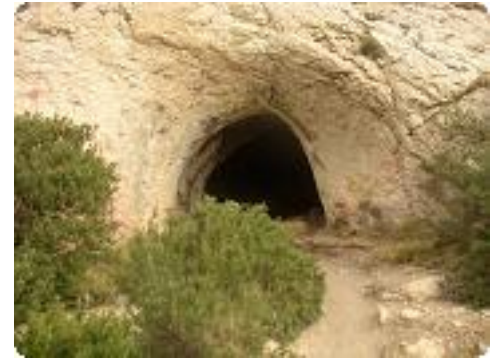
[18] De nombreuses grottes.