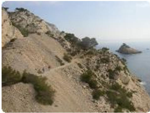
[31] Le sentier du douanier.