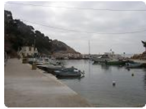
[3] Le port.