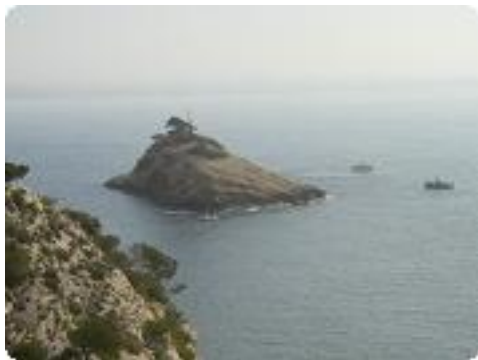
[34] L'île d'Erevine.