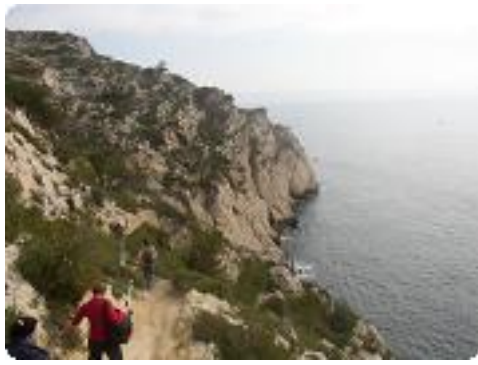
[25] Le sentier du douanier.