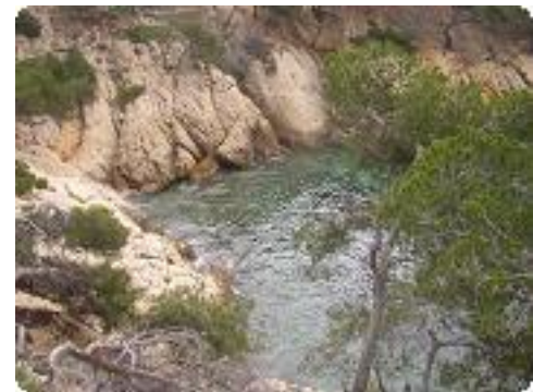
[12] Une crique.