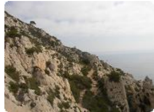
[21] Le sentier du douanier.