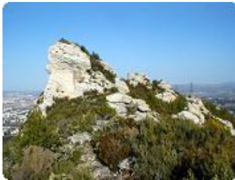
[20] Une ancienne poudrière.