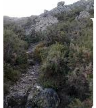
[12] Arrivée au mont 'St Cyr'.