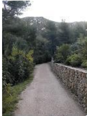
[5] La Murette II, le retour.