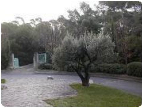
[1] Entrée du parc.