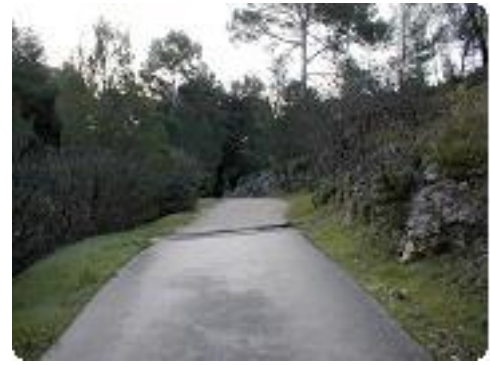
[3] Tout droit.