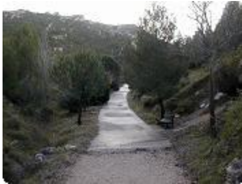
[8] Prendre direction Mont 'St Cyr' par les vallons.