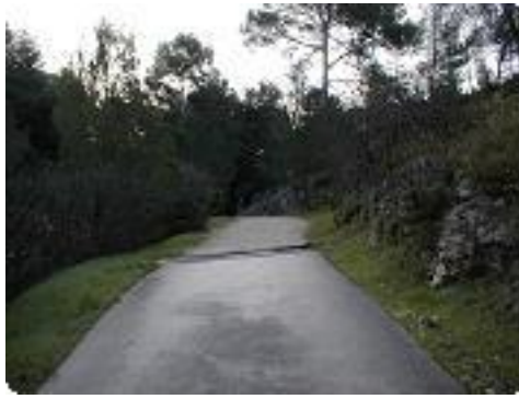
[2] Petite côte pour démarrer.