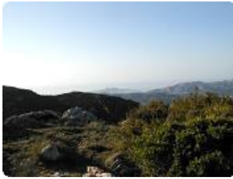
[14] Un peu tout.