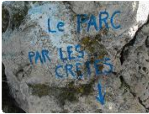
[17] Descente facile.