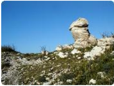
[13] Un peu de l'île 'Riou'.