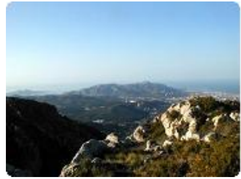
[15] 'Marseille' et les îles du 'Frioul'.