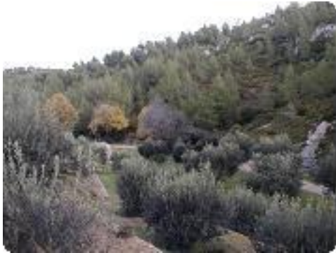
[7] Seconde côte.