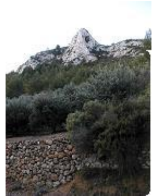
[6] Vue sur la gauche.