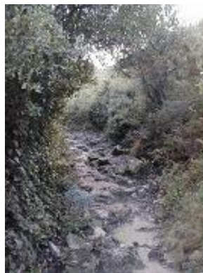
[11] Arrivée au pas 'Richaud'.