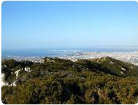
[16] La direction à prendre.