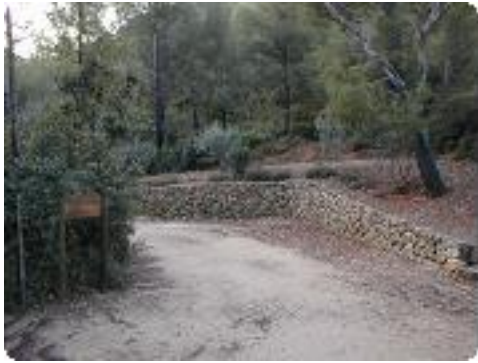
[4] La murette.