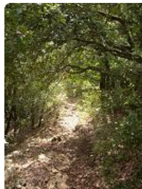
[11] ..et s'enfonçant dans la végétation.