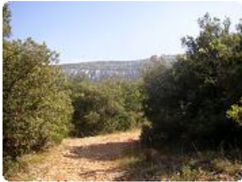
[28] Fin de la montée.