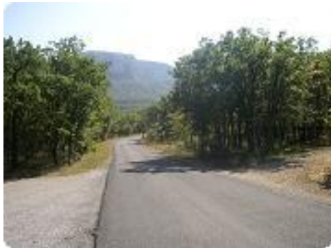
[31] Traverse de la route.