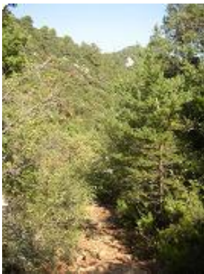
[19] Encore une descente.