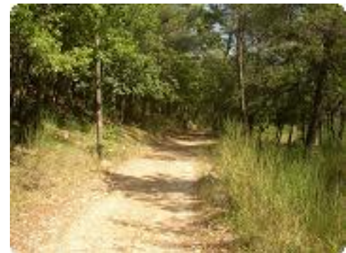
[24] Suivre le GR sur la droite.