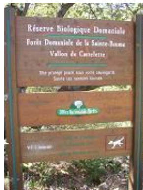
[23] La pancarte d'entrée dans la réserve.