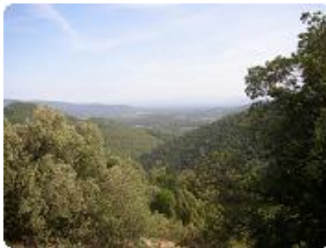
[8] Vue sur l'autre versant.