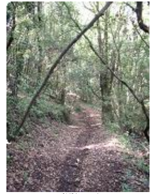
[15] Le sentier.