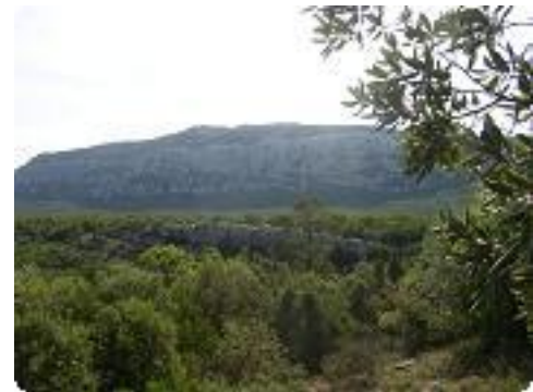
[9] La Sainte-Baume.