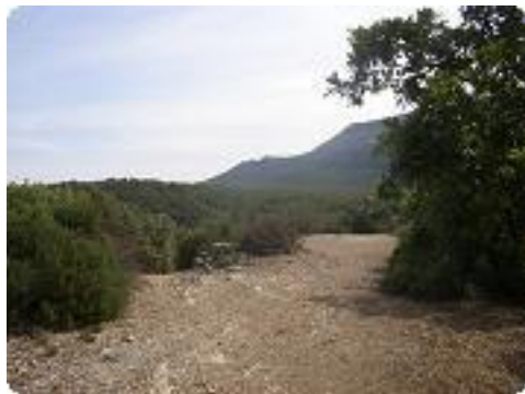
[7] Traversée d'une étendue de pierres.