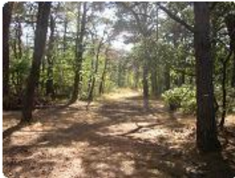
[32] Un dernier passage en forêt.