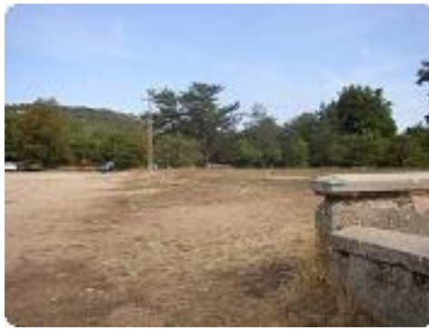
[2] Début du tracé vert.