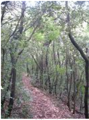
[13] Le sentier.