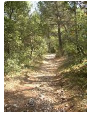
[27] La montée.