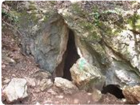
[16] La grotte de la Castelette.