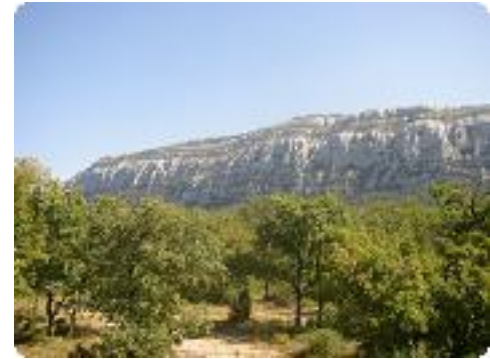
[30] La Sainte-Baume.