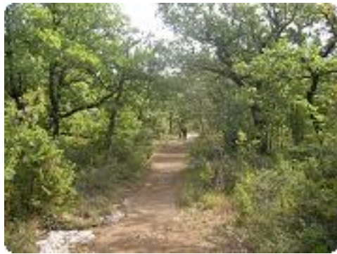
[4] Entrée dans la forêt de chênes.