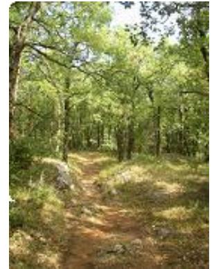
[6] ..puis retour dans la forêt.