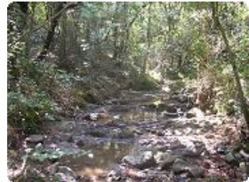
[21] Peu d'eau en été.