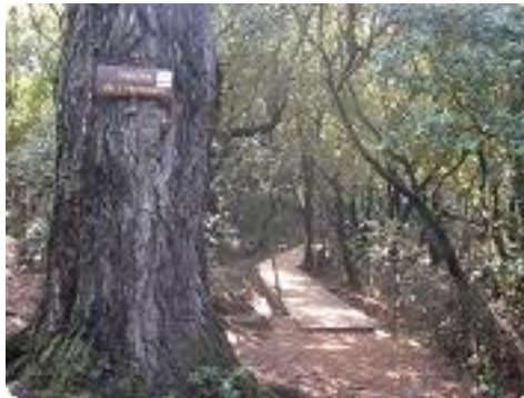
[20] Arrivée à la source de l'Huveaume.