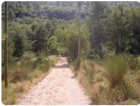
[25] Un large chemin.