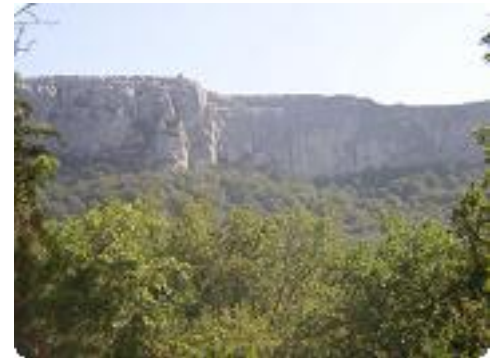
[33] The End.