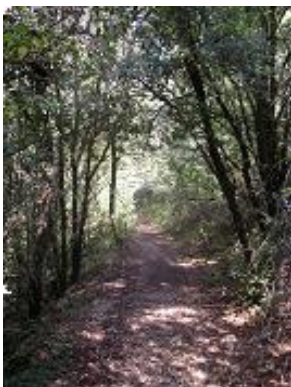
[22] Le sentier parallèle à la rivière.