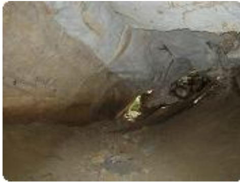
[17] L'intérieur de la grotte.