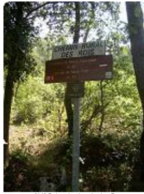
[26] Suivre le chemin des Roys.