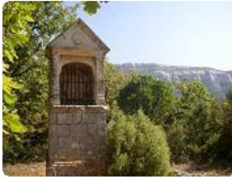
[29] Un oratoire.