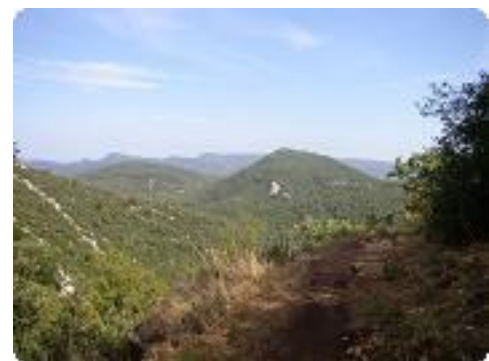
[12] Le vallon.