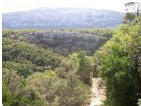
[10] Le sentier descend..