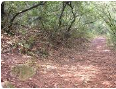
[14] A gauche vers la grotte.