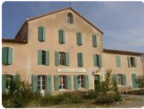
[1] L'écomusée de la Sainte-Baume.