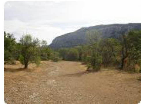
[3] La Sainte-Baume sur la droite.