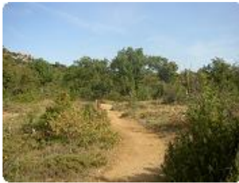
[5] Passage dégagée..