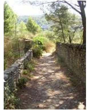
[6] Le chemin après le château,