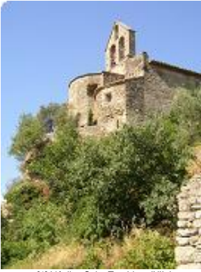
[1] L'église Saint-Trophime (XIIe).