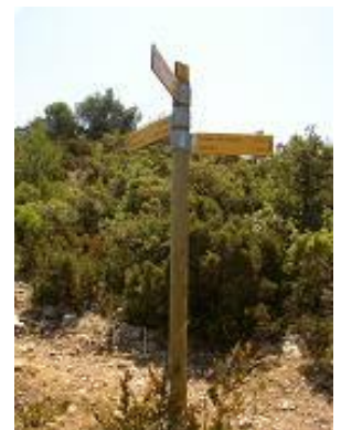
[12] Panneau indicateur.