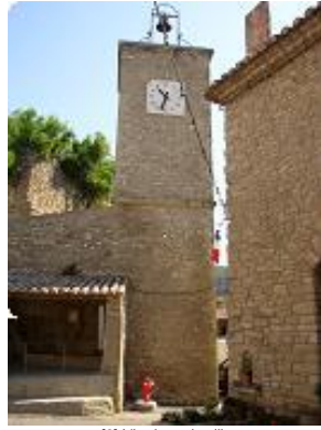
[2] L'horloge du village.