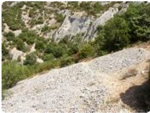
[16] La remontée.