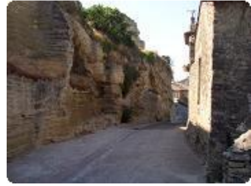
[3] Dans les ruelles du village.