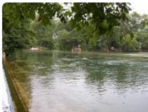
[23] Un bain fraîcheur dans la Sorgue.