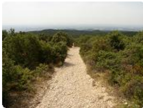
[20] Large chemin descendant.