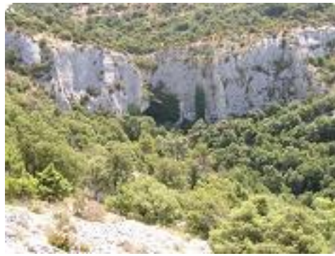
[14] Descendre au pied de ces rochers,