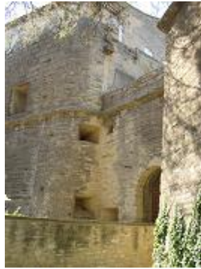
[5] Le château (XIIe).