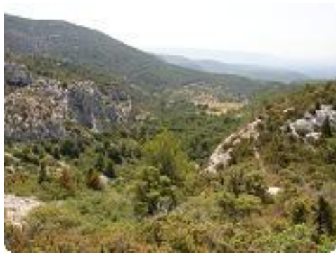
[13] Le paysage.