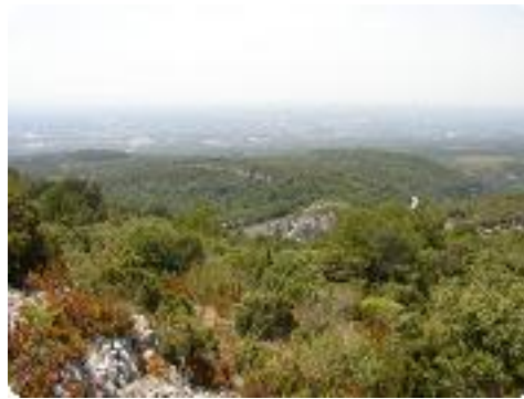
[17] La vue.