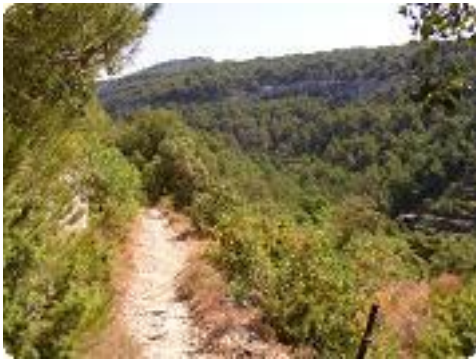
[7] devenant un petit sentier.