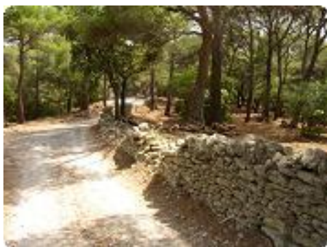
[22] Juste avant l'arrivée au château.