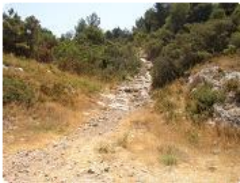
[11] Quittons le chemin pour suivre le sentier.