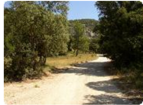
[9] Un large chemin de terre.