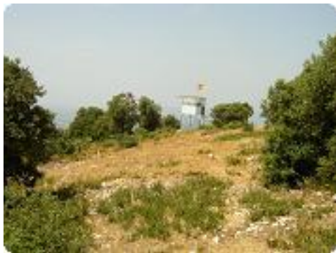
[19] Arrivée au poste de vigie des Trois Luisants.