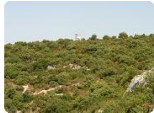
[18] On distingue le poste de vigie.