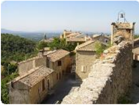
[4] Le village vu des remparts.