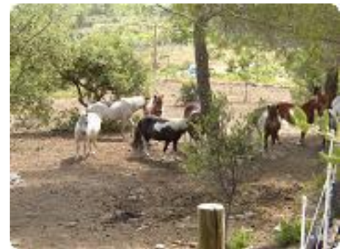
[21] Quelques chevaux sur le retour.